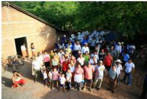
Replicar proyectos éxitos por toda la región