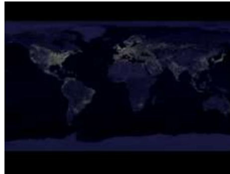
Mayor acceso a la tecnologías y energías renovables