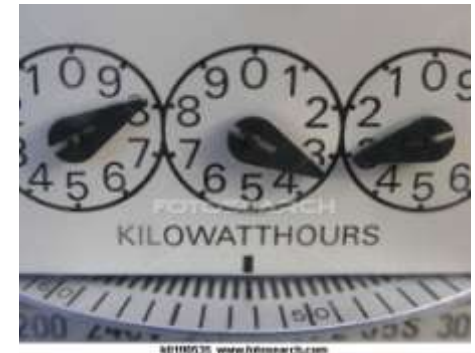
Apoyar medidas y programas de eficiencia energética

...una visión a largo plazo de los consumidores y desarrolladores de proyectos.