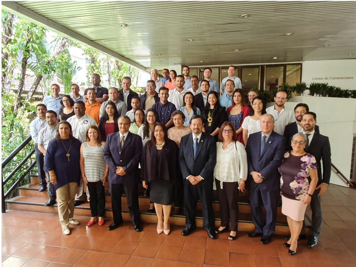
Figura 3. Grupo de trabajo que participó del LVIII Foro del Clima de América Central, realizado en Casa de Centroamérica SICA, San Salvador, El Salvador; abril 2019.