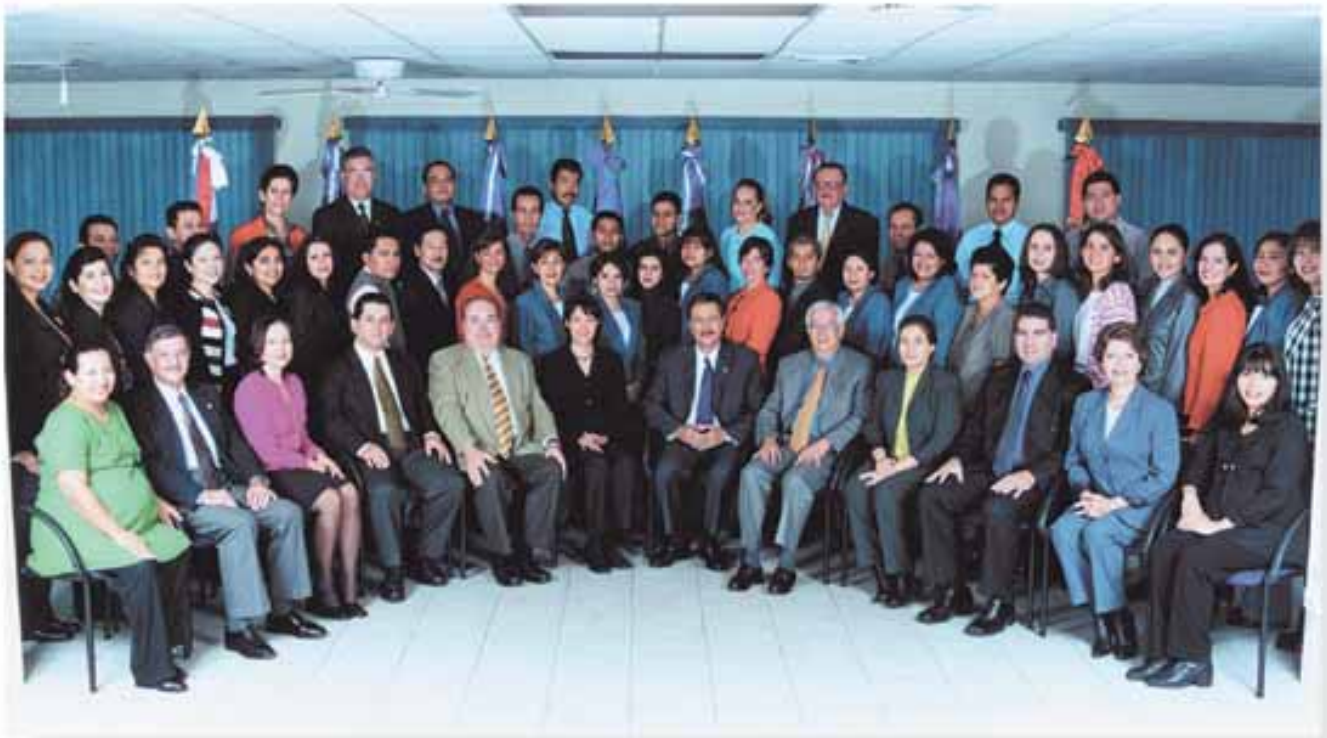
Personal de la SG-SICA