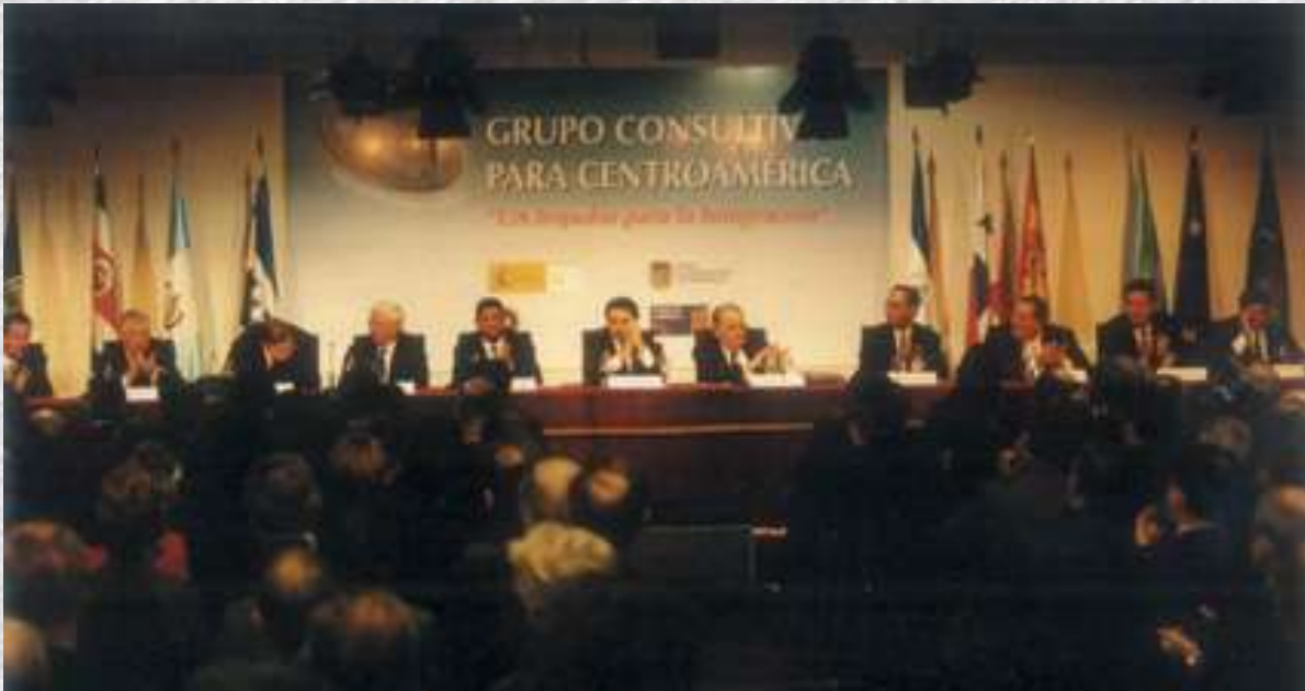
CUMBRE DE PRESIDENTES CENTROAMERICANOS